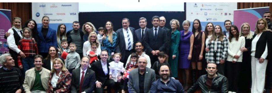
Des athlètes/parents honorés par la commission pour l'égalité des genres du CNO hellénique.

Fin 2022, plus de 700 invités ont assisté à la cérémonie des Prix sportifs lituaniens qui a honoré les athlètes olympiques et paralympiques les plus méritants et leurs entraîneurs. Organisé par le CNO