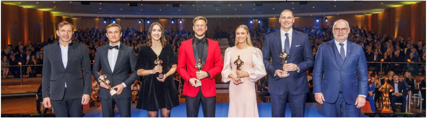
Les athlètes estoniens de l'année 2022.

de la flamme des Jeux Athènes 2004 et Rio 2016. Plus d'infos ici .