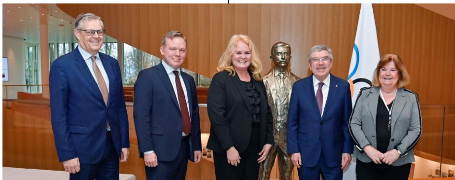
Le président Bach avec la délégation du CNO suédois.