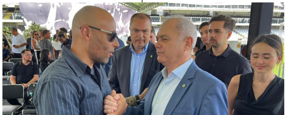
Le président du CNO brésilien à l'hommage à Pelé à Santos.

Le président Paulo Wanderley et le directeur général Rogério Sampaio ont représenté le CNO brésilien le 2 janvier dernier lors de l' hommage à Edson Arantes do Nascimento, Pelé, au stade Vila Belmiro de Santos. Au nom du Mouvement olympique brésilien, ils ont rendu un dernier hommage au plus grand athlète du siècle, grand passionné et supporter des Jeux Olympiques et du sport brésilien en général. Lors de la cérémonie de clôture de Londres 2012, Pelé est apparu au moment de la présentation de Rio 2016. Quelques mois avant la cérémonie d'ouverture de Rio 2016, il a reçu l'Ordre Olympique des mains du président Thomas Bach, à Santos. Pelé a également participé au relais