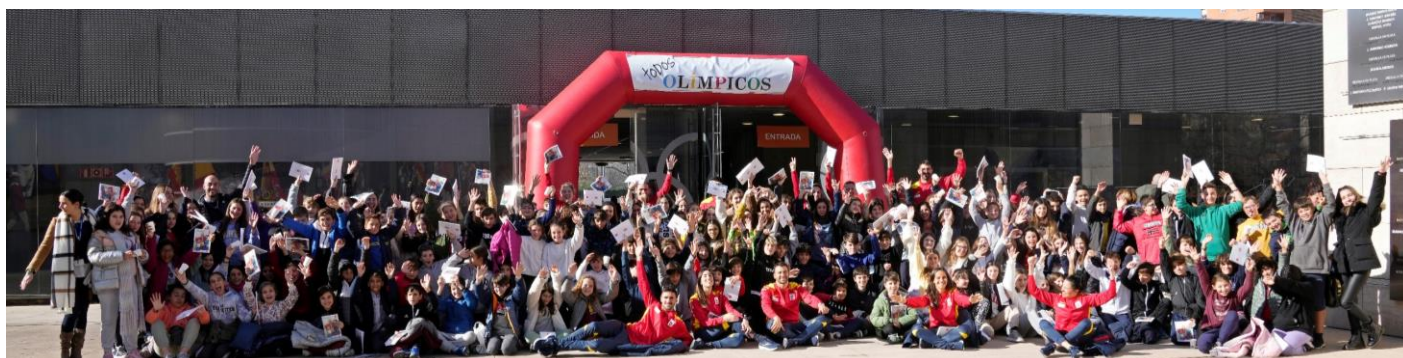
Lancement de la 15 e campagne 'Tous Olympiques' au siège du CNO espagnol.

Le 11 janvier, Paris 2024 et l'Agence française de développement (AFD) ont dévoilé les projets lauréats de la troisième édition de l'appel à projets Impact 2024 International. Ces initiatives participent prioritairement à l'égalité des sexes, l'éducation, la santé et l'inclusion des personnes en situation de handicap, conformément aux priorités communes de Paris 2024 et de l'AFD pour l'héritage des Jeux de Paris 2024. 10 projets ont été sélectionnés parmi les 202 projets mis en œuvre dans 35 pays africains différents et qui ont été déposés lors de cette édition. Détails complets ici .