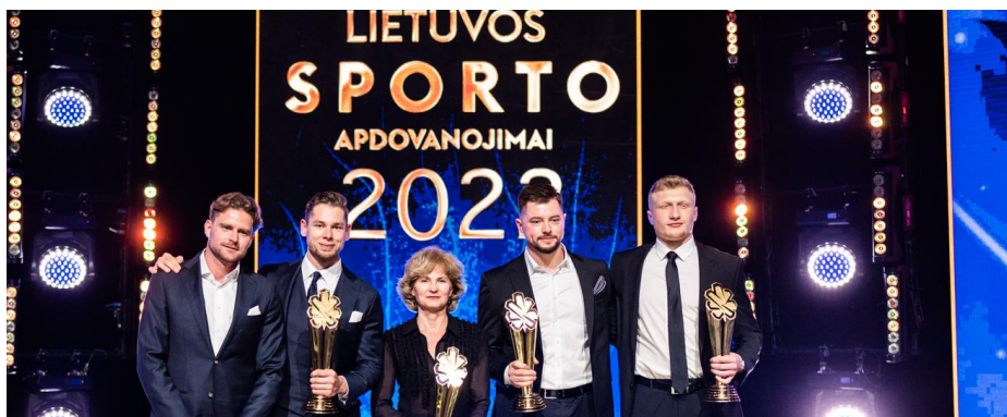
La cérémonie des Prix sportifs lituaniens.