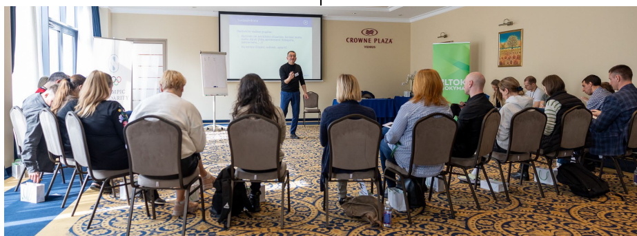
Formation en administration sportive pour des entraîneurs lituaniens.

Pour la sixième fois, le CNO a invité une vingtaine d'entraîneurs à une formation gratuite en administration sportive. Cette année, le programme était axé sur l'intelligence émotionnelle et la gestion des conflits. Parmi les participants