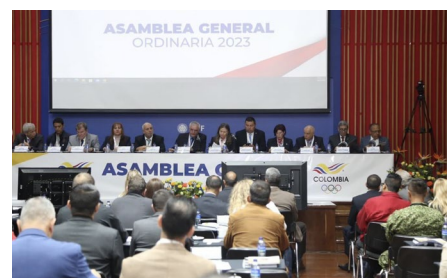
Assemblée générale ordinaire du CNO colombien.

Le CNOSF lance son cycle d'atelier du programme 'Insertion par le sport'. Initié dans le cadre de sa politique d'insertion par le sport, axée vers l'attraction et la remobilisation des publics éloignés de la pratique, le CNOSF souhaite accompagner les