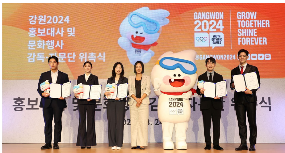
Célébration des 300 jours avant Gangwon 2024 avec les nouveaux ambassadeurs et la mascotte Moongcho.

du CNO ainsi que l'estimation du budget 2023.