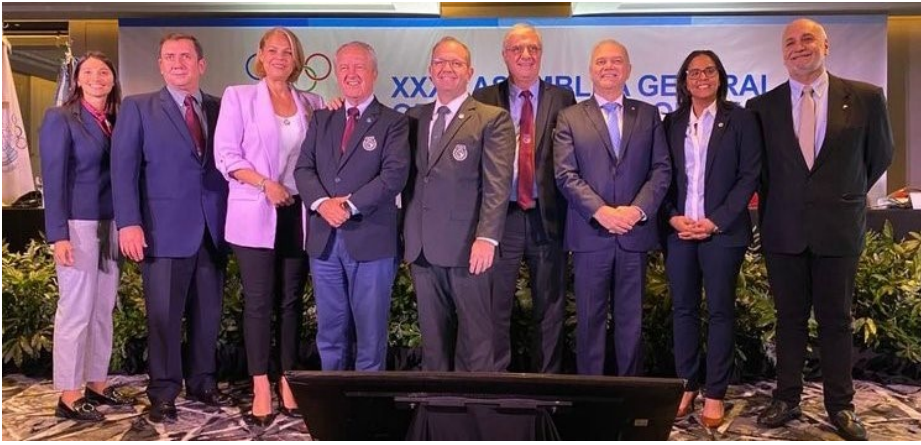
Le nouveau comité exécutif de l'ODESUR.

leurs présidents, vice-présidents et représentants au Conseil de fondation de l'AMA. Les nouveaux membres du Conseil de fondation seront formellement intronisés une fois que les statuts révisés de l'AMA qui reflètent la dernière série de réformes de gouvernance de l'Agence auront été officiellement approuvés par le Conseil de fondation et les autorités suisses. Communiqué complet ici .