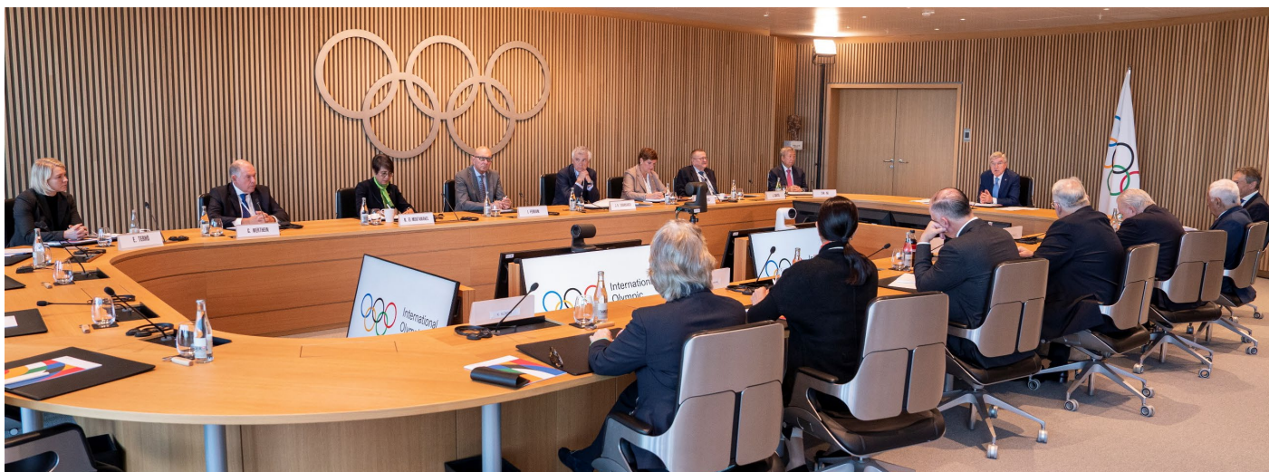
Le président Bach menant les trois jours de réunions de la CE du CIO à la Maison Olympique.