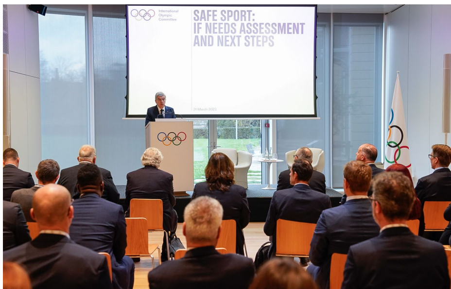
Le président Bach à la réunion sur la pratique du sport en toute sécurité.

Également cette semaine, le président Bach s'est adressé à des responsables de FI participant à une réunion sur la pratique du sport en toute sécurité. À cette occasion, il a souligné l'importance d'un travail d'équipe afin de renforcer la prévention et d'apporter une réponse adéquate à la problématique liée à la protection dans le sport. Au cours de la réunion, les résultats de l'évaluation des besoins des FI en matière de protection dans le sport ont été présentés et les participants ont discuté des prochaines étapes pour le CIO, en termes de réponse aux principales préoccupations des parties prenantes en abordant le renforcement de la protection dans le sport au niveau local. Communiqué complet ici .