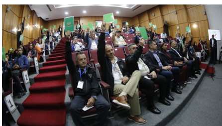
Les délégués votent lors de l'assemblée générale du CNO vénézuélien.