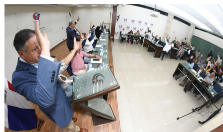
Séance de vote à l'assemblée générale du CNO de la République dominicaine.

structures du Mouvement sportif dans leurs projets à vocation sociale. Plus d'infos ici . Par ailleurs, le CNOSF a célébré son cinquantième anniversaire avec l'organisation d'une réception tenue le 28 mars à la Maison du Sport français. À cette occasion, le CNOSF a accueilli les acteurs du sport français et présenté notamment une rétrospective de ses actions. Un message de félicitations du président du CIO a été diffusé au début de la cérémonie. Infos sur www.franceolympique.com