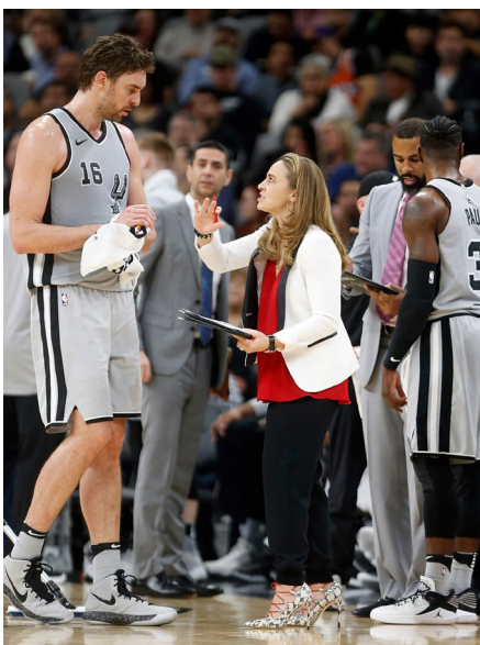
Pau Gasol recevant des conseils de Becky Hammon, entraîneuse adjointe des Spurs de San Antonio.

Alors que le mois consacré à l'égalité des genres touche à sa fin, la star espagnole du basketball et membre du CIO, Pau Gasol, réfléchit à la capacité qu'a le sport de promouvoir l'égalité, de combattre les stéréotypes et d'aider les filles à poursuivre leurs rêves et leurs objectifs. Découvrez ses réflexions ici .